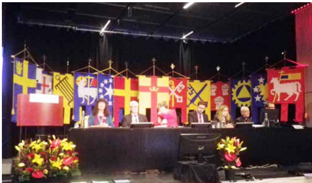
Bakom kyrkomötets presidium finns Svenska Kyrkans standar och de tretton stiftens olika standar. Kan du vilken som står för vilket stift? Rätt svar kommer i nästa nummer.

måste tas upp igen efter ett kyrkoval och att det då behövde bli 3/4 majoritet för att därmed få igenom frågan. Utskottet hade föreslagit avslag och på tisdagen var det debatt. Men vi blev informerade om att socialdemokraterna ville göra ett tilläggsförslag samtidigt som de gick med på att bifalla utskottets förslag och avslå motionen om vigselrätt. Deras förslag var i korthet ”att utreda frågan om vilka åtgärder som behöver vidtas för att säkerställa att ingen utsätts för diskriminering i samband med den kyrkliga handlingen vigsel”. Vi beslöt att inte gå med på deras tilläggsförslag. Debatten höll på i över två timmar där flera gick upp och talade för det där tilläggsförslaget. Det kom också upp en diskussion om det var riktigt att släppa igenom ett sådant tilläggsförslag