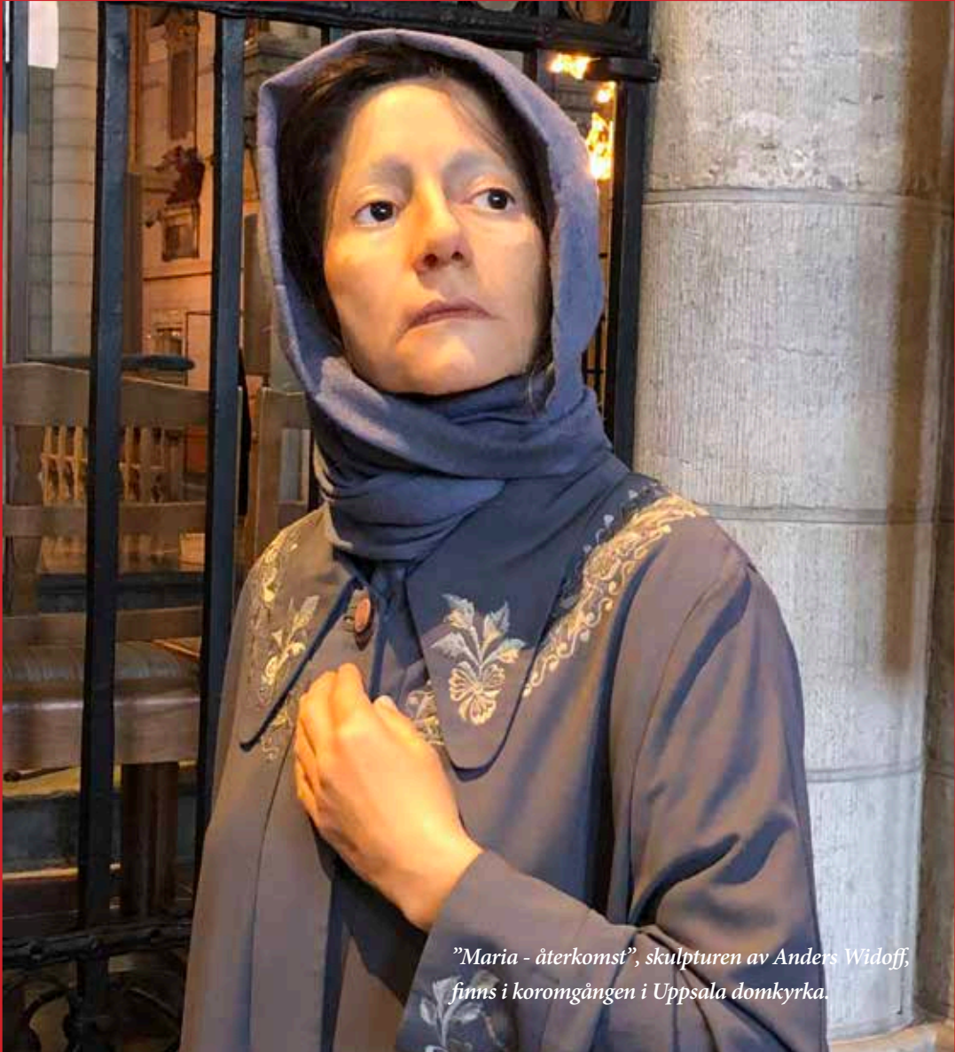
”Maria - återkomst”, skulpturen av Anders Widoff, finns i kororgången i Uppsala domkyrka.